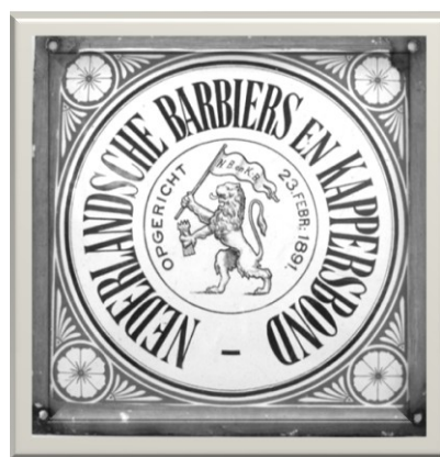
Tegel oprichting barbier- en kappers- bond, te zien bij salon Dries, Nieuwe Ebbingestraat in Groningen, 2015

Dat lukte niet snel en dus knipte hij mijn melkboe-renhondenhaar sluik naar links of rechts, dit naar keu-ze. Verder schoor hij de zij- en achterkant hoog op, model oorlogskapsel. Na de ‘kaalpluk’ spoot hij met een soort DDT-flitsspuit er een beetje ‘lekker roek’ op. Daarna ruimde vrouw De Wind de geofferde lok-ken van de kokosmat en dat alles voor ongeveer een kwartje.”