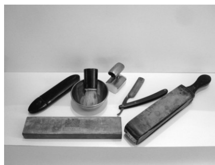
Oude attributen, te zien bij salon Dries, Nieuwe Ebbingestraat in Groningen, 2015

Meestal ging je zonder afspraak naar de kapper. Was het er druk, dan ging je rechtsomkeert of je bleef juist zitten om de roddels aan te kunnen horen (zonder nieuwsgierig te lijken ...). Zelfs kapperszaken die naast elkaar staan, hebben een bestaan gehad. De adresboeken melden: Siertsema Hoendiep 116 (216) en Salomons Hoendiep 117 (217). Behalve de kapsalons waar geknipt