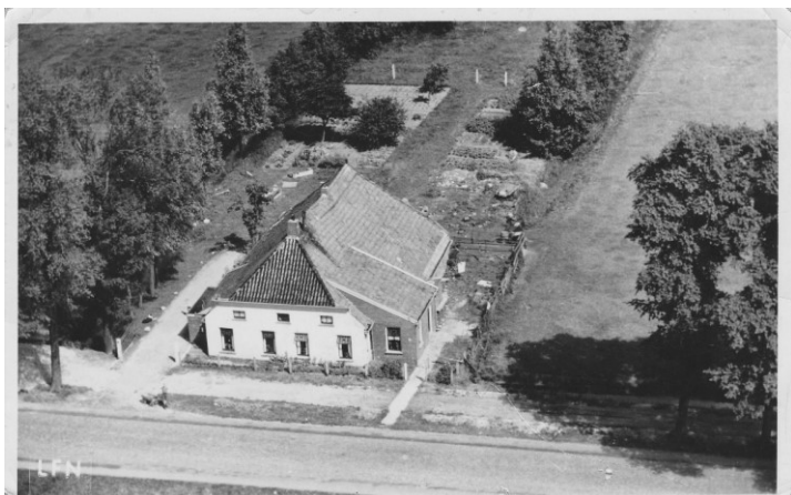
Hoendiep 53, op de plek waar nu Ferrorent zit.

Hoendiep 51, die van dezelfde persoon pachtte.