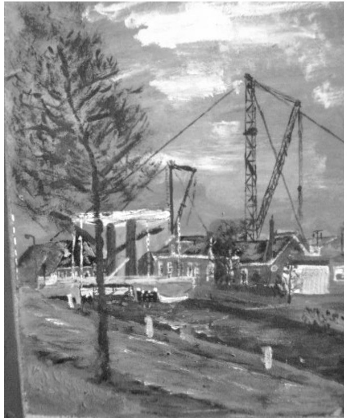
Een door Reint Wobbles geschilderd tableau vivant, vanuit westelijk oogpunt gezien, met de brug, het streekje aan de Roderwolderdijk en op de achtergrond een hijskraan van de scheepswerf van Barkmeijer.

Het deed me denken aan een voorval, eind jaren vijftig. Er kwam een schoolvriend bij me om te spelen. Op een gegeven moment vroeg mijn vader: “ Wat dut dien pa mienjong (wat is het beroep van jouw vader)?” De jongen antwoordde: “Mijn vader is schilder bij de suikerfabriek”. “Mwaah...schilder”, zei mijn vader, “dat noem ik eigenlijk een vaarver ”. Dat voelde als het uitknippen van een tubetje verf en mijn speelkameraad liep rood aan. “Verver? Nee, een schilder”, probeerde hij nog. Maar mijn vader liep naar het café, vanwege zich aandienende klandizie.